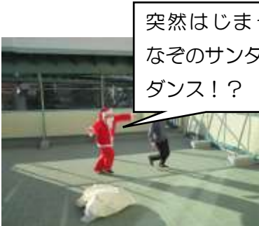
突然はじまった なそのサンタ ダンス！？