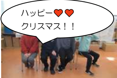
ハッピー♥♥ クリスマス！！