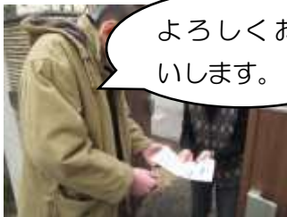
よろしくお願 いします。