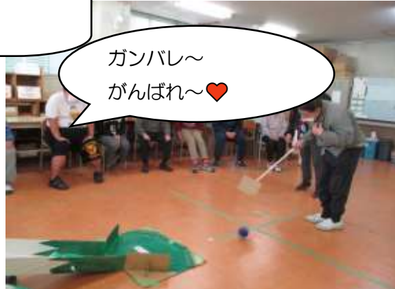
ガンバレ～ がんばれ～❤️