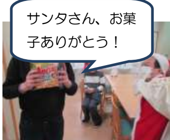
サンタさん、お菓子ありがとう！