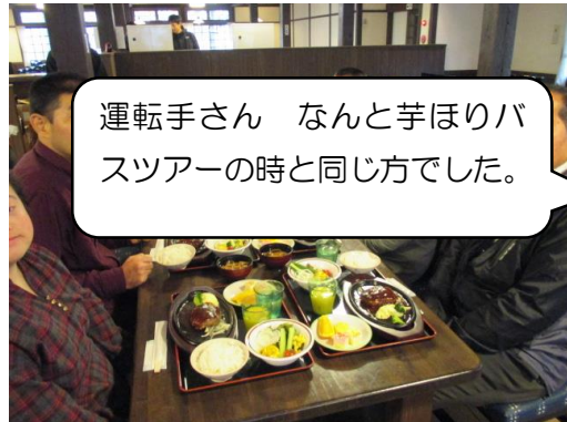
運転手さん なんと芋ほりバ スツアーの時と同じ方でした。

公園のあとはモンテールお菓子工場へ！！普段は、みることのできないケーキやお菓子を作っている製造ラインをじっくり、見学したあとは、シュークリームやエクレアの試食です。できたてほやほやをたくさんいただきました。エクレアはチョコを下にして食べると舌にチョコがのっておいしいとのこと。早速アドバイスどおり食べてみました。お土産と、思い出をいっぱい詰め込んで、定刻どおり無事清新館に到着！帰りの車内から虹も見れましたネ。いつもボランティアで参加して下さるお二人、見守りありがとうございました。