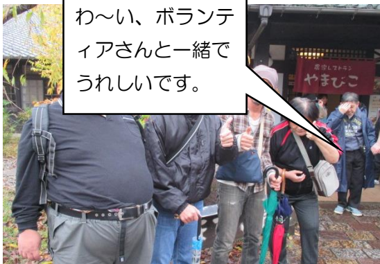
わ～い、ボランテ ィアさんと一緒に うれしいです。