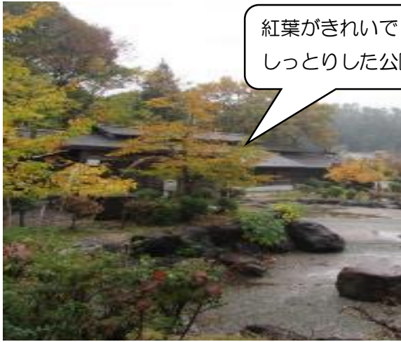
紅葉がきれいで しっとりした公園