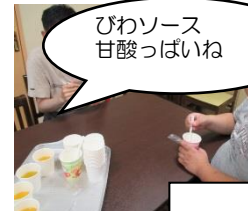
びわソース 甘酸っぱいね

5月びわやいちごを収穫してそのまま食べたりミキサーでつぶしてヨーグルトにかけたり、畑の恵みをいろいろ工夫してみんなで食べています。農薬つかってないから安心!!